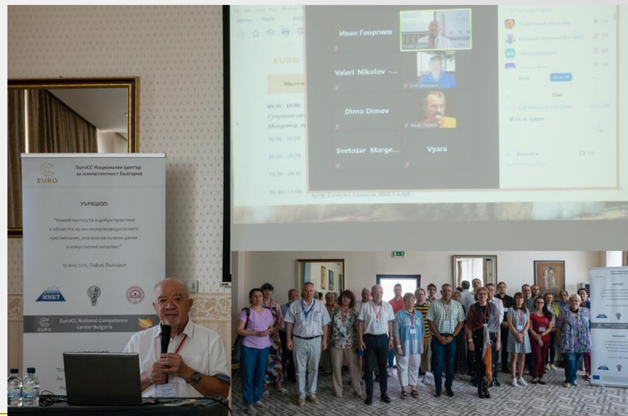
NCC Bulgaria Workshop 15-07-2021 (hybrid event)